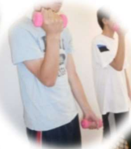
フィジカル トレーニング